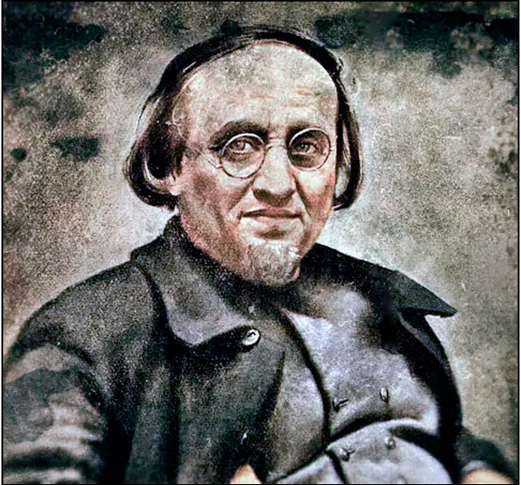
Ernest-Lucien Juin (Émile Armand)